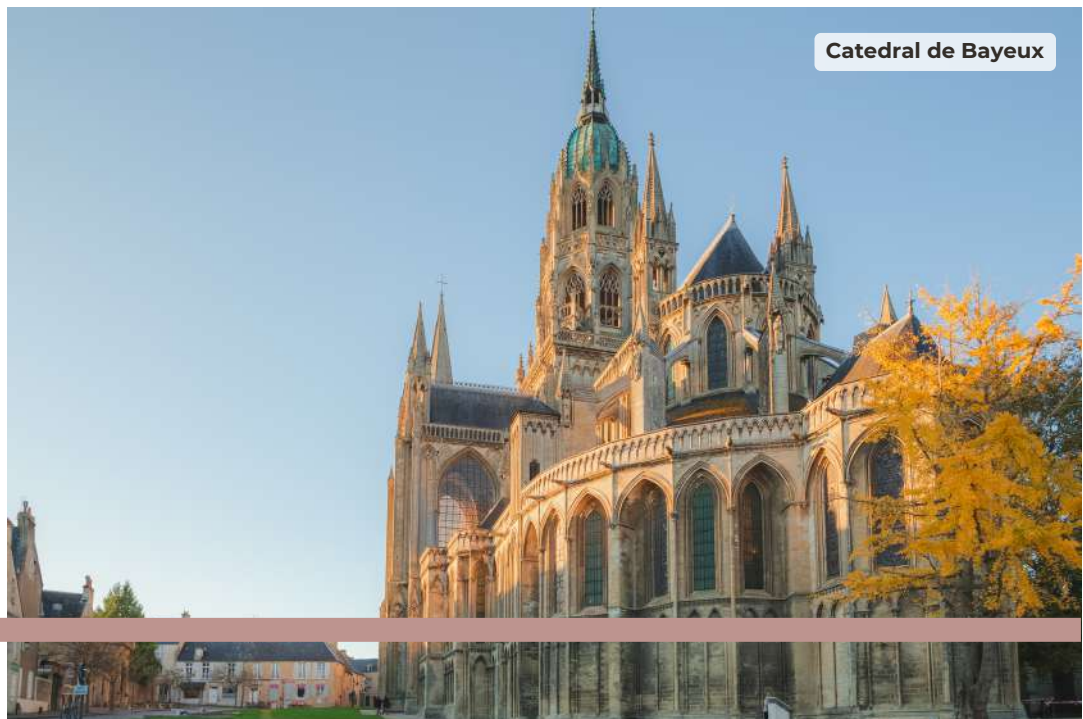
Catedral de Bayeux