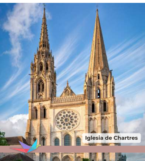
Iglesia de Chartres

Desayuno en el hotel y después salida hacia aeropuerto de Orly o Charles de Gaulle para tomar el vuelo con destino a la ciudad de origen.