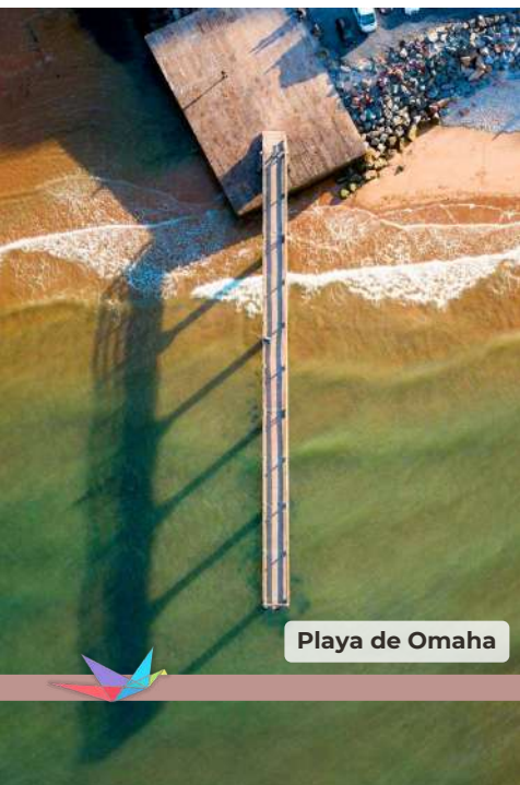
Playa de Omaha